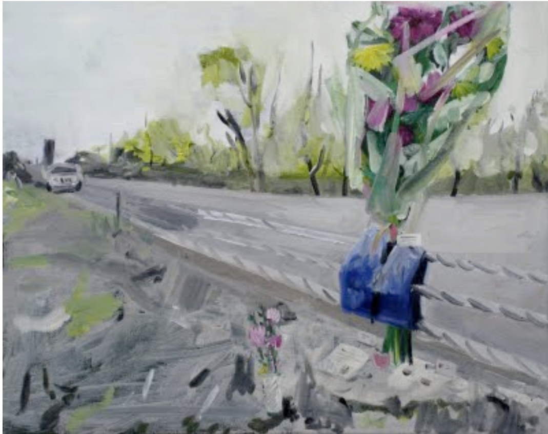
"A car accident on Togo Ghana express way", 22x27cm, oil on canvas, 2011