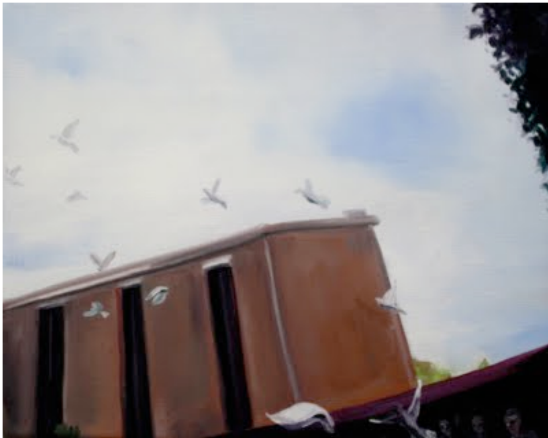
"White doves were set free", 19x24cm, oil on canvas, 2011