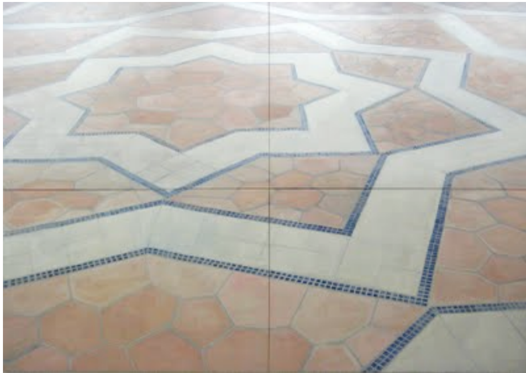
"A place to stay forever", oil on 4 canvases, 226 x 330 cm, 2011

Publicerad i Sydsvenskan den 2 september 2011