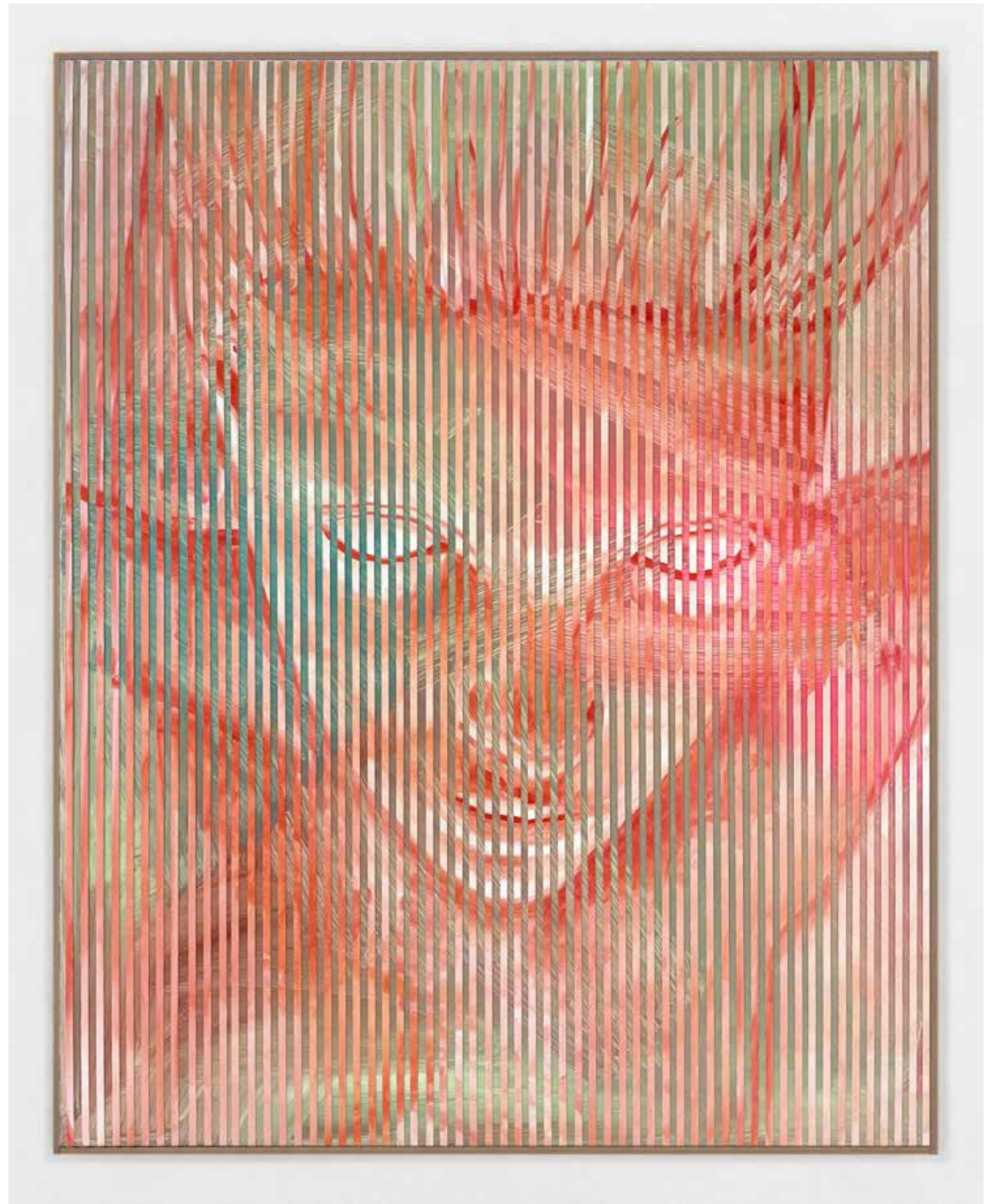
Goddess Interfered 9, 2025 Acrylics and oil on two canvases, intertwined 150 x 120 cm

Drawing on her own experiences and memories of the sea, Ditte Ejlerskov has created a number of new works featuring the Nordic sea goddess Rán as the focal point. The inclusion