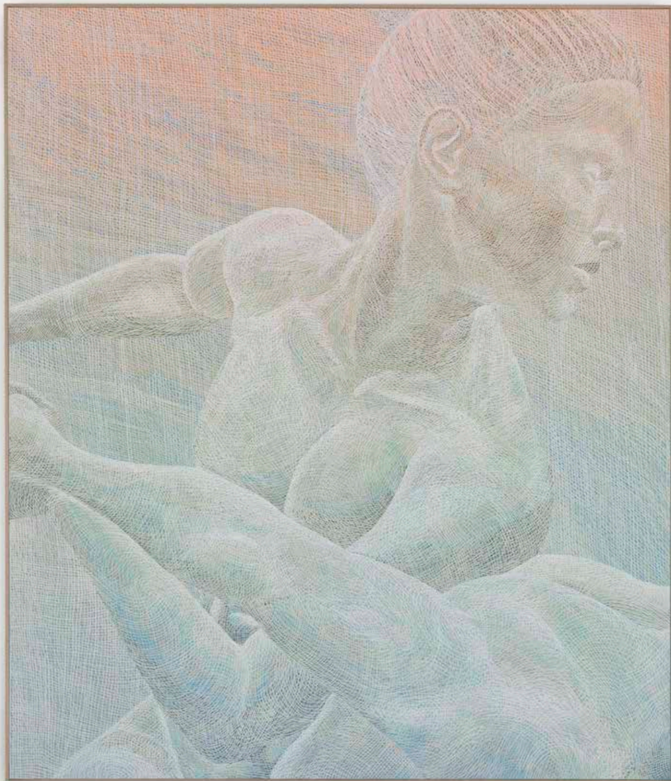
The Mesh Fight 1, 2022 Mixed media on canvas 210 x 180 cm Vendsyssel Kunstmuseum Erhvervet med støtte fra 15. Juni Fonden

The Wrestlers forestiller to brydende kvinder og er baseret på den antikke skulptur af samme navn, som i sin oprindelige form forestiller to brydende mænd. Siden den oprindelige skulptur blev genopdaget, ved en udgravning i 1583, er den blevet kopieret, afstøbt og bearbejdet mange gange, som der også har været tradition for med mange af antikkens skulpturer, blandt andet for at udbrede de klassiske idealer og den gode smag, man forbandt dem med. Den findes som replika på en lang række kunstsamlinger og museer; heriblandt i gips på Den Kongelige Afstøbningsamling på SMK. Skulpturen er også en del af digitaliseringsprojektet SMK Open, hvor den er scannet og gjort tilgængelig som digital 3D objekt, som frit kan downloades og bruges af publikum. Ejlervskovs The Wrestlers taler således både ind i en lang skulpturtradition og italesætter samtidig internettets iboende utopiske muligheder for informationsdeling, globale udvekslinger og kommunikation.