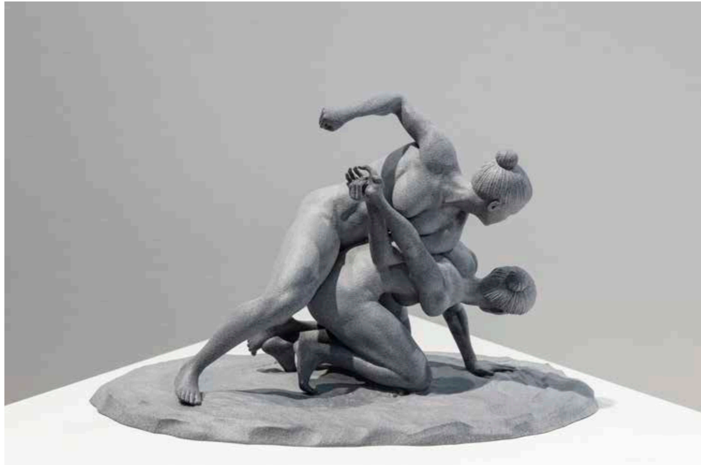
The Standing Fight (Raw Grey), 2022 3D printed sculpture in HP MJF PA12 22 x 14 x 14 cm Vendsyssel Kunstmuseum Erhvervet med støtte fra 15. Juni Fonden

For museet indebar det nomadiske projekt fra starten af en eksperimenterende tilgang til, hvad et museums- og kunstrum kan være. Efter 30 år som traditionel "hvid kube", flyttede museet kunsten ud i bevægelse mellem forskellige kontekster, fællesskaber og tidsligheder. Siden da har museet været i proces med at udarbejde en stedsspecifik og tidsbaseret arbejdsmetode for et levende museumsrum, hvor udstillinger skabes i tæt dialog med omgivelserne. I denne museumsform må museet som gæst i andres kontekster forholde sig ydmygt og nysgerrigt til disse steders fortællinger og strukturer, ligesom kunsten bruges til at åbne op for nye refleksions- og diskussionsrum. The Wrestlers har spillet en vigtig rolle for museets første tid som nomadisk kunstmuseum. Det virtuelle rum har museet, fra starten af dets nomadiske praksis, anset som et interessant offentligt og æstetisk rum, hvor der findes nye muligheder for forbindelser til lokale såvel som nationale og globale besøgende.